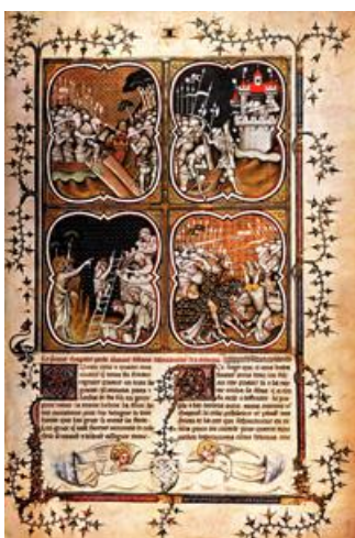
Az itt látható miniatúra Franciaországban készült, 1375 körül.

A mai konstruktivista megközelítések nézőpontjából azonban szokatlan lehet, egyrészt, hogy Szűcs megpendíti az érem másik oldalát is: nevezetesen, hogy a modern nemzet – bármennyire konstrukció is –, bizonyos mértékben mégiscsak épített a rendi nemzeti előzményekre is. 10 Másrészt – és ez Szűcs elemzésének legeredetibb gondolata, még napjainkból visszatekintve is – kimutatta, hogy a rendi nemzet(tudat) bizonyos mértékben éppúgy konstrukció eredménye, mint a modern nemzeti identitás; ráadásul mindkét konstrukció hasznosított korabeli nyugati mintákat is.