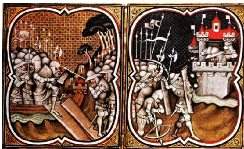
Az első két képkockán görögök által ostromolt Tróját láthatjuk...