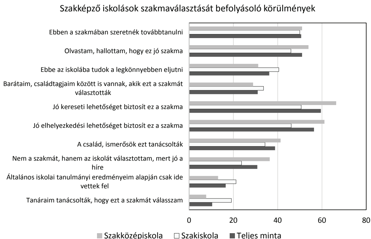
1. ábra. A szakképző iskola- és szakmaválasztás szempontjait nagymértékben jellemzőnek tartó tanulók aránya a képzés típusa szerint, Dél-Alföld Régió, 2015 (%)